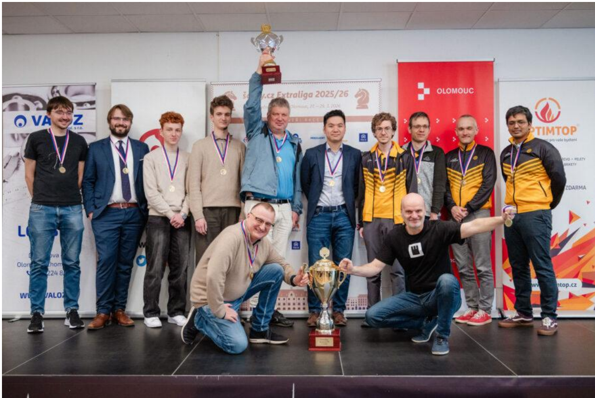
Hráči 1. Novoborského ŠK se radují z 15. extraligového titulu

Gratulujeme 1. Novoborskému ŠK k zisku již 15. titulu mistra české extraligy!