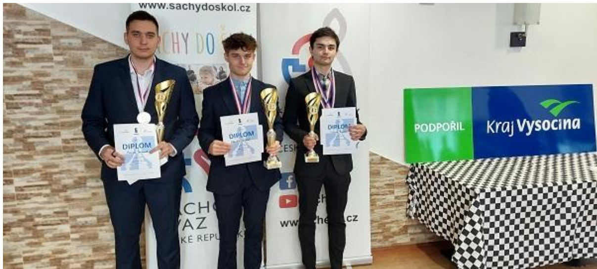
Nejlepší tři hráči