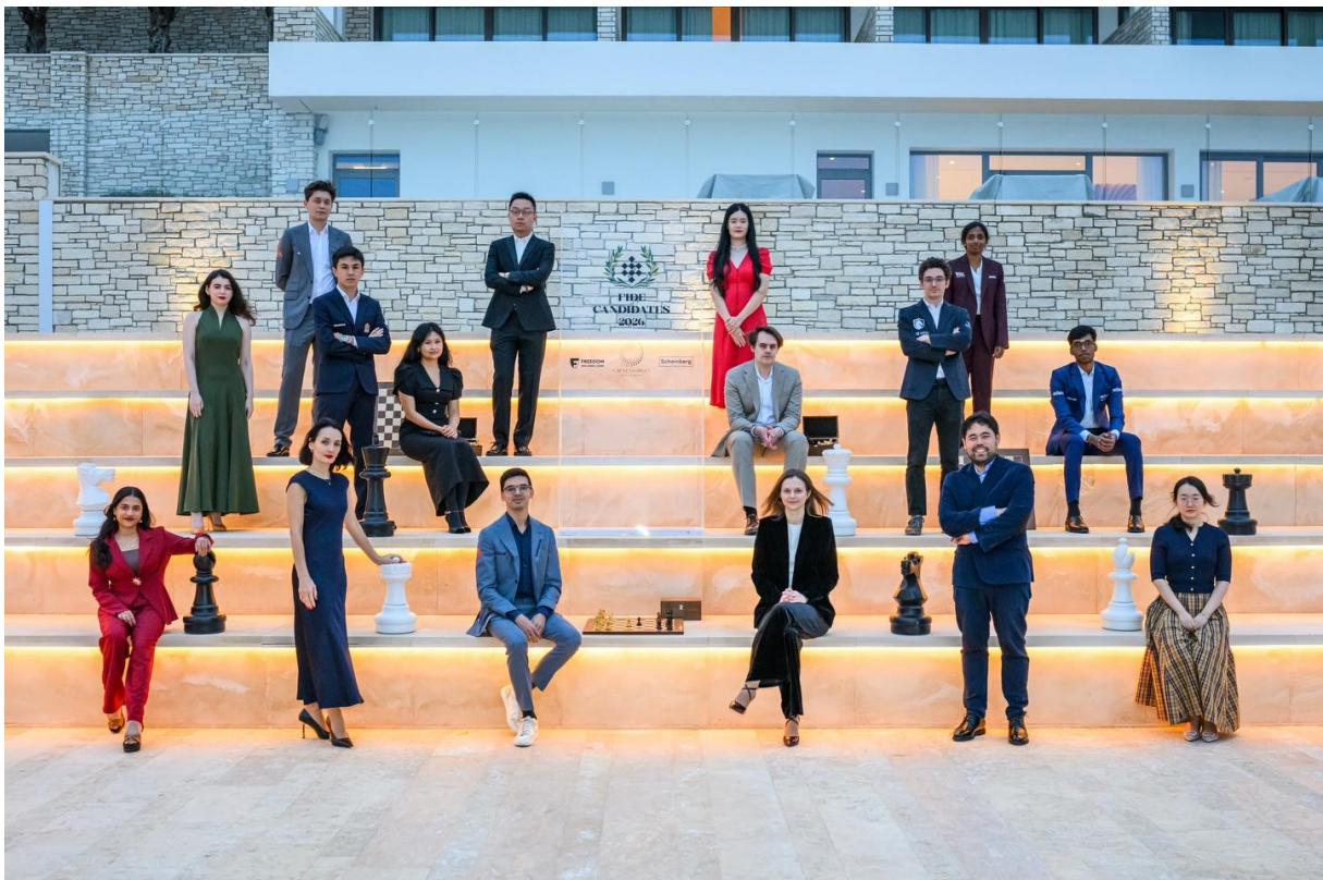
Účastníci Turnaje kandidátů pro rok 2026

Nejblíže vedoucímu hráči je zkušený Anish Giri, který na něj ztrácí dva body. Před 13. kolem by třetí místo držel Fabiano Caruana se ziskem 6 bodů.