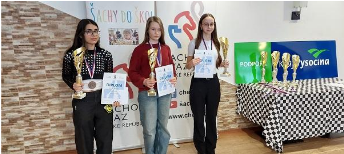
Nejlepší tři hráčky