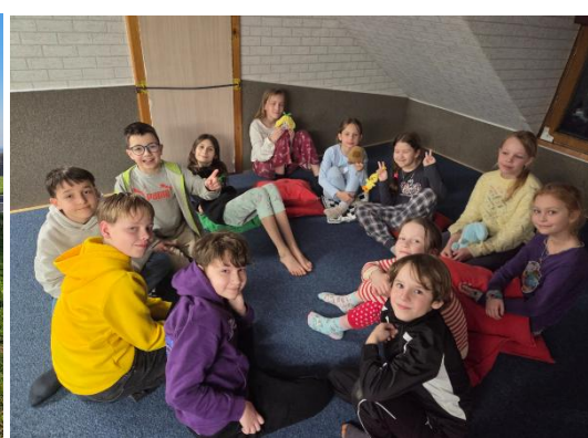
Volný čas se trávil například u fotbálku nebo u městečka Palerma.

Scouting tak nabídl nejen kvalitní trénink, ale i příjemnou atmosféru a prostor pro navazování nových přátelství.