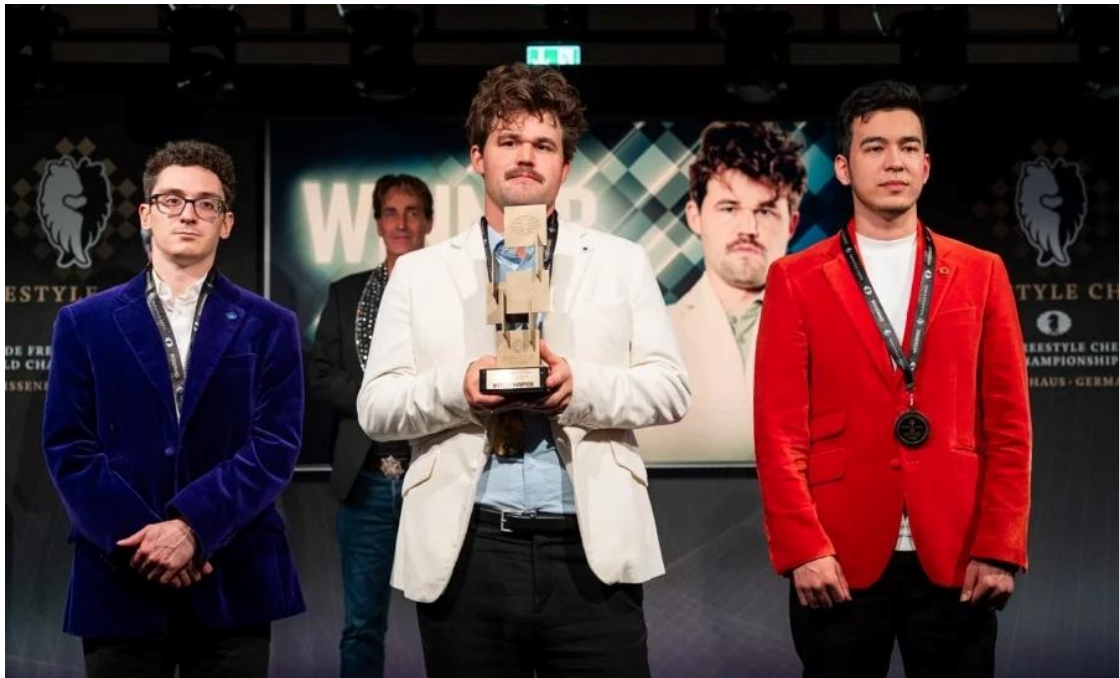
Vicemistr světa Fabiano Caruana, mistr světa Magnus Carlsen a bronzový Nodirbek Abdusattorov

Medailisté si zároveň zajistili postup do příštího ročníku mistrovství světa ve Fischerových šachách.