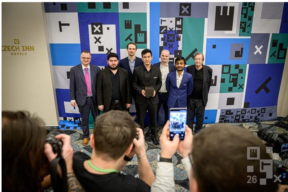
Vítězové skupiny Masters

Šampionem osmého ročníku Masters turnaje Pražského mezinárodního šachového festivalu, jenž se konal ve dnech 24. února – 7. března v hotelu Don Giovanni, je Nodirbek Abdusattorov. Uzbecký velmistr vyhrál prestižní turnaj podruhé v historii. Stal se tak prvním šachistou, kterému se to povedlo. O obsazení stupňů vítězů se rozhodovalo až v posledním kole. Stříbro v nejprestižnější kategorii nakonec bere Parham Maghsoodloo a bronzové umístění vybojoval obhájce loňského vítězství Aravindh Chithambaram. Oběma pomohly partie proti do té doby suverénnímu Jordanovi van Foreestovi, které Nizozemce nakonec odsunuly až na nepopulární čtvrtou pozici. Česká legenda David Navara obsadil páté místo.