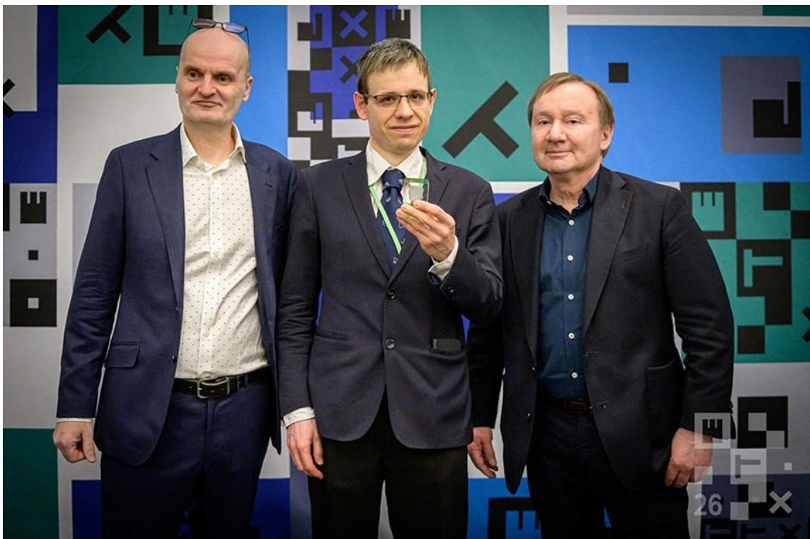
David Navara přebírající Cenu Lubomíra Kaválka