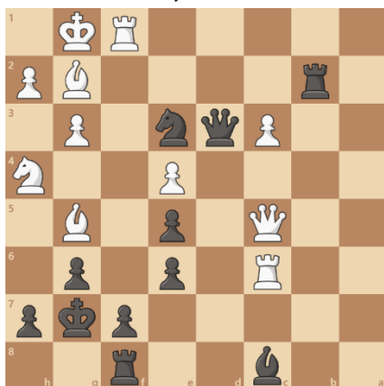
černý na tahu

Řešení: 1... Vxg2+ 2. Jxg2 (nebo 2. Kh1) Dxf1#