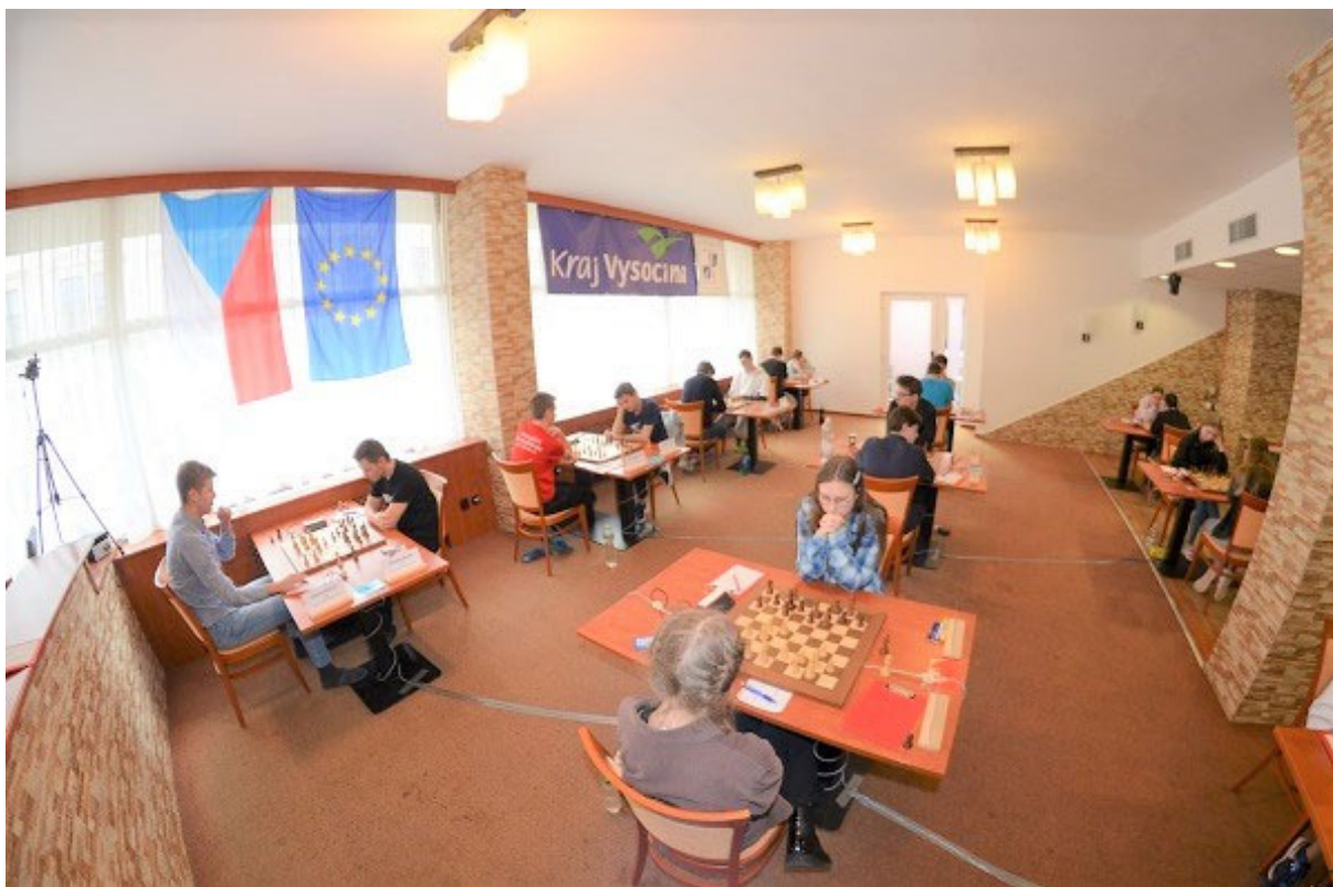
Hrací sál Mistrovství ČR juniorů a junierek 2023