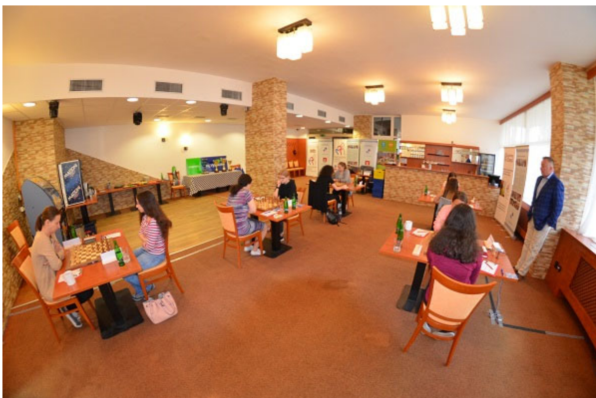
Hrací sál Mistrovství ČR žen 2022