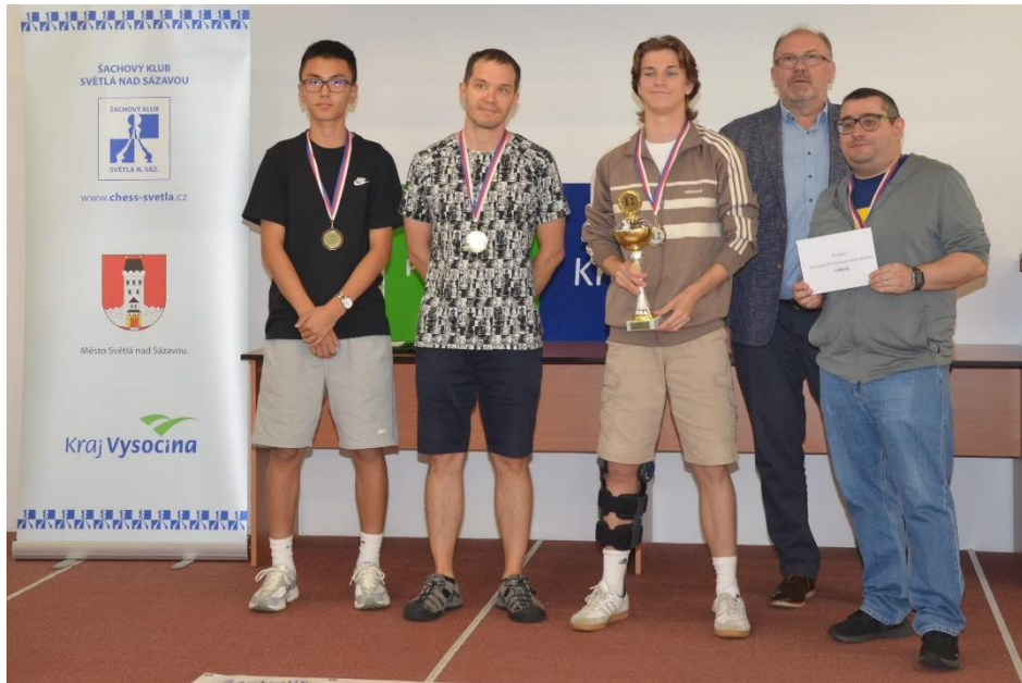
ŠK Polabiny „A“

V neděli 7. září 2025 se hrálo Mistrovství České republiky družstev v bleskovém šachu 2025. Týmy hrály švýcarským systémem na 15 kol. Tempo hry bylo 3 minuty na partii + 2 sekundy na tah pro každého hráče.