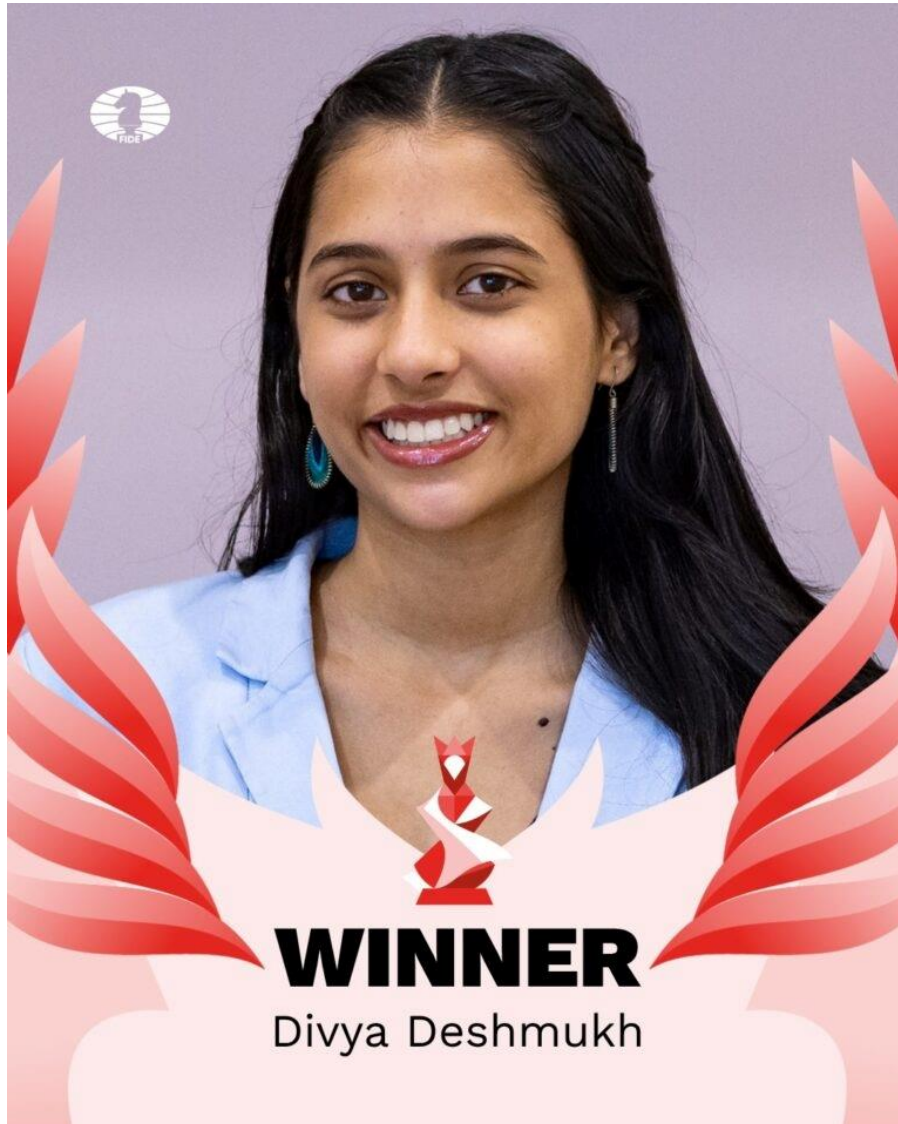
Vítězka Světového poháru pro rok 2025 — Divya Deshmukh

kandidátek a zároveň se stala první Indkou v historii, která vyhrála Světový pohár žen. Kromě skvělého triumfu získala i titul velmistra.