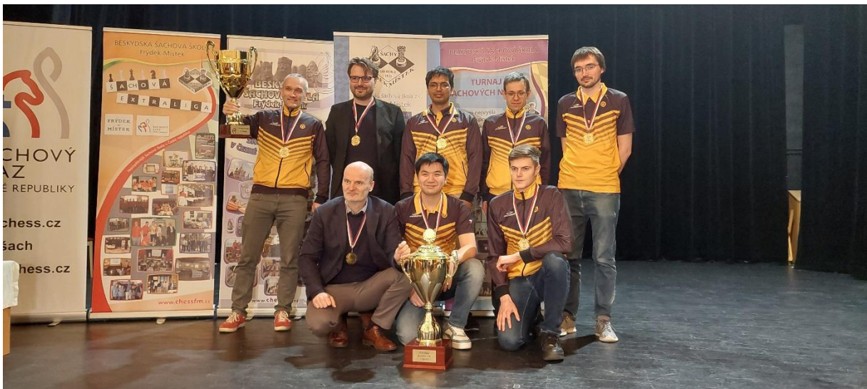
1. Novoborský ŠK a jeho 14. triumf v nejvyšší tuzemské lize

Závěrečné trojkolo nejvyšší tuzemské šachové soutěže, jež se odehrálo 28. až 30. března, hostil Frýdek-Místek. Dvanáct týmů se sjelo do Národního domu, kde kromě těžkých extraligových bojů místní šachisté touto významnou akcí zahájili oslavy 100 let frýdecko-místeckého šachu. Letošní ročník nabídl pro diváky pikantní zápasy nejen o medailové příčky, ale také v záchranářských misích. Králem Extraligy se po vydařeném závěru stal již poctřináctý tým 1. Novoborský ŠK!