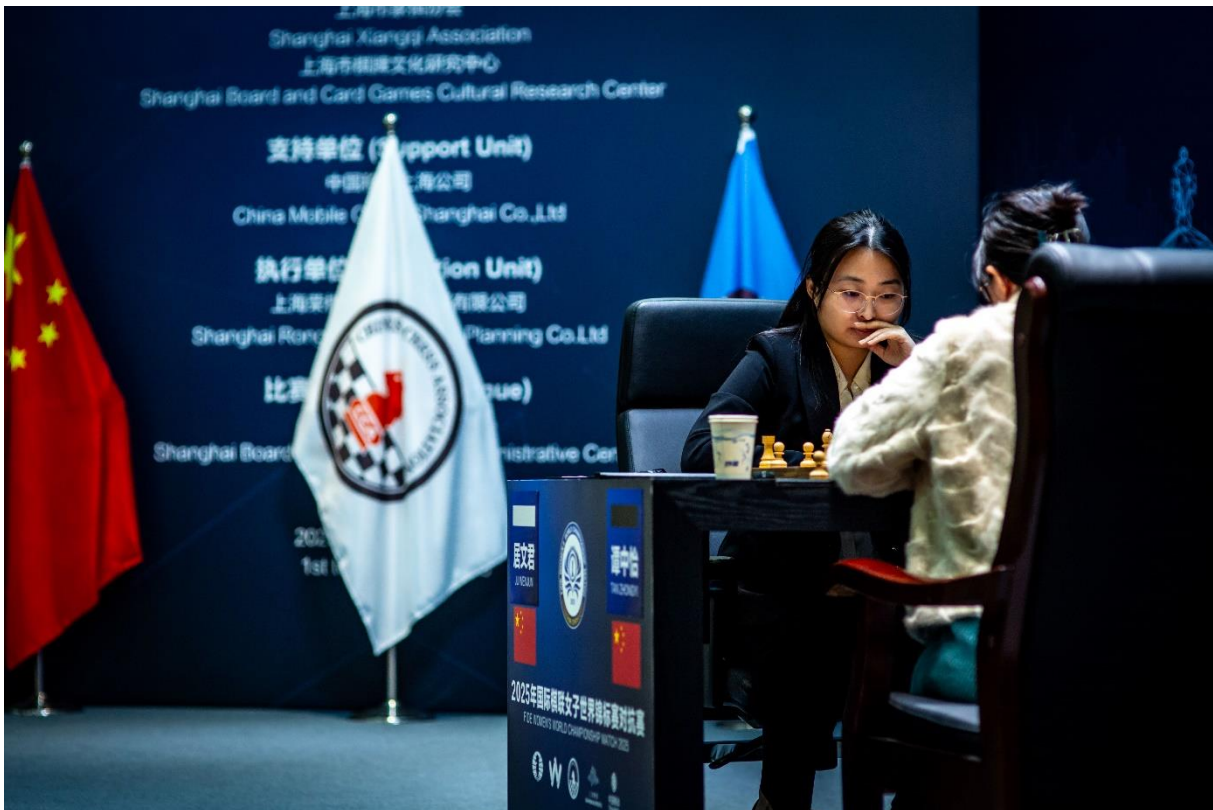
Fotografie z dění 1. partie

A jaký je aktuální stav zápasu? Po šesti kolech vede Ju Wenjun 4:2. Dokáže Tan Zhongyi ve druhé polovině utkání – a navíc na domácí půdě – otočit skóre a získat zpět královskou korunu?