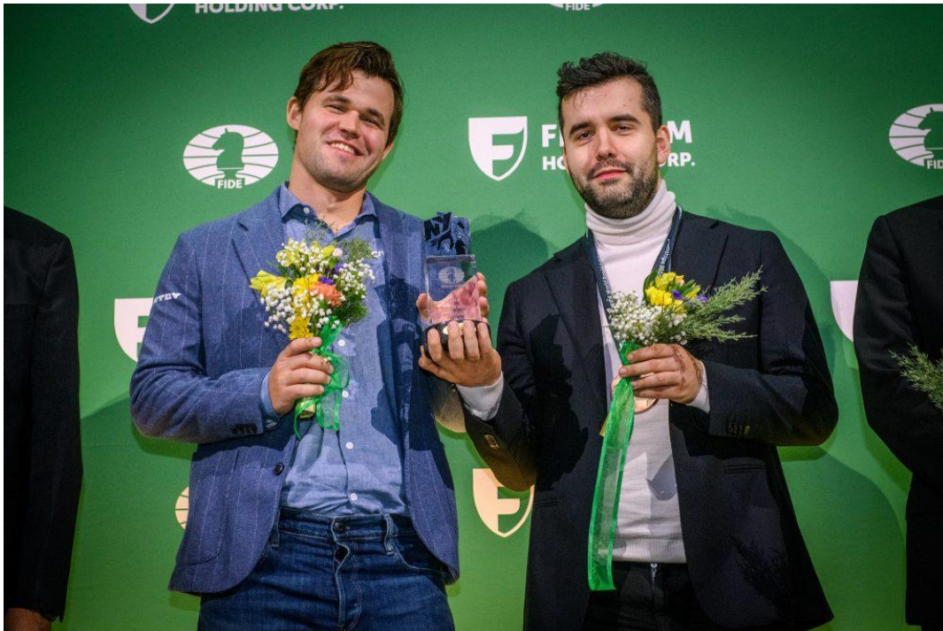
Spolumistři v bleskovém šachu — Magnus Carlsen a Ian Nepomniachtchi

New York se bez pochyb zapsal do historie jako „festival plný překvapení“. Více zajímavostí a kuriozit nabízí rozsáhlý článek.