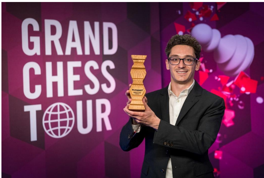
Vítěz Superbet Chess Classic 2024 – Fabiano Caruana

Po čas turnaje šlo jasně vidět Caruanovo umění v klasickém šachu. Američan byl povětšinou ve vedení, avšak poslední kolo představovalo stopku vítězným oslavám. Hrstka pronásledovatelů – Alireza Firouzja, Dommaraju Gukesh a Rameshbabu Praggnanandhaa – jej dostihla, což znamenalo, že rozklíčování šampiona proběhlo pomocí tiebreaku. V tiebreakovém tempu 10+5 zcela exceloval Fabiano Caruana. Stupně vítězů doplnil druhý Alireza Firouzja a třetí Dommaraju Gukesh.