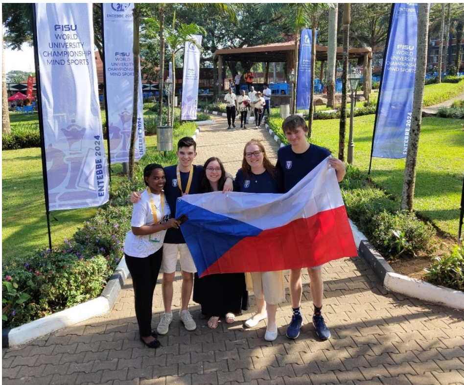
Česká výprava s tamější dobrovolnicí