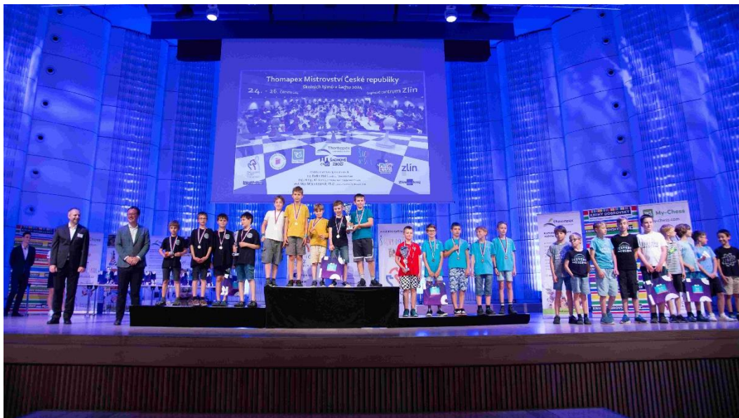
Vítězové kategorie 1.—5. stupeň

Ve dnech 24.—26. 6. 2024 se v Kongresovém centru Zlín odehrálo Thomapex MČR školních týmů. Město Tomáše Bati je v poslední dekádě velmi oblíbenou destinací školáků, na konci června se totiž jednalo již o 6. ročník v této lokalitě! Celkový počet 94 týmů nabízel napínavou podívanou. Pro odraťování se od turnaje byl pro zájemce nabízen doprovodný program pro všechny věkové kategorie. Děti mohly z široké nabídky například navštívit mrakodrap s proslulou kanceláří či vyzvat GM Martina Petra a FM Jakuba Kůsu v simultánce. A jak vše dopadlo?