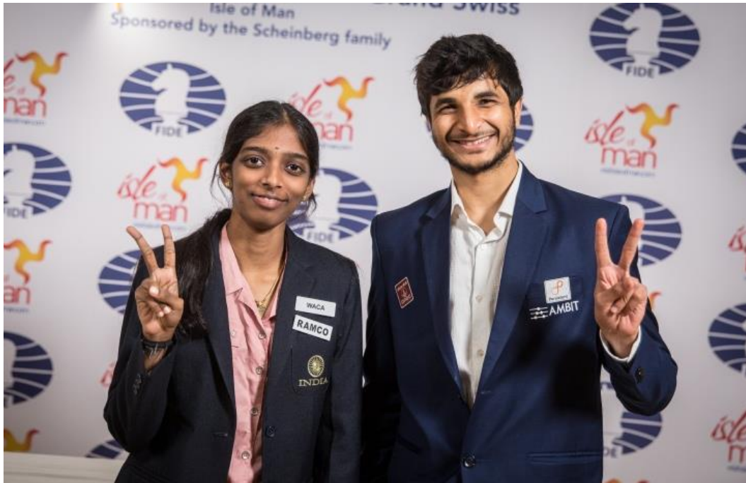
Indické duo - Rameshbabu Vaishali a Vidit Santosh Gujrathi

Více informací naleznete zde. ( https://www.chess.cz/fide-grand-swiss-ovladlo-mlade-duo/ )