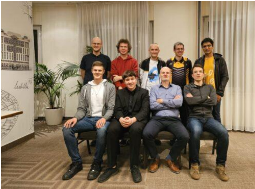
1. Novoborský ŠK

O víkendu 14.—15. 10. 2023 se v různých koutech České republiky zahájil další ročník tuzemské nejvyšší soutěže. Nejvíce ze všech celků si počínal ŠK Moravská Slavia, která deklasovala své soupeře (INGEM - ŠK Líně a ŠŠ Vávra a Černoušek Unichess) vysoce 6,5:1,5. Dalším týmem, jenž získal cenných 6 bodů do tabulky je 1. Novoborský ŠK. Ten se utkal s týmy z opačné strany ČR – ze Zlínského kraje. Skvělé vyhlídky do dalších bojů mají i zbylá 6bodová mužstva: Sigil Fund Pardubice a BŠŠ Frýdek-Místek. Na protipólu nynějších lídrů se nachází 3 celky, jež se jim zatím nepodařilo skórovat: Šachy Hošťálková, ŠŠ Vávra a Černoušek Unichess a INGEM - ŠK Líně.