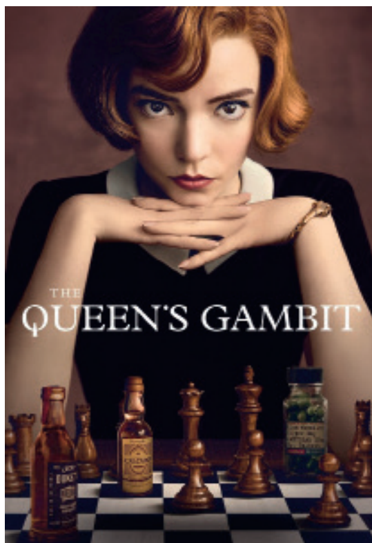
Seriál Dámský gambit spustil hotové šachové šílenství. Po jeho odvysílání vyskočil prodej šachových sad a šachové literatury o stovky procent a na herní platformu Chess.com se přihlásily statisíce nových hráčů.

Podle slov české ženské šachové jedničky je pak obecně pro ženy nejtěžší udržet soustředění po celou dobu partie. „Z mé zkušenosti ženy hůře udrží kon- centraci při partii, která trvá například čtyři hodiny, a občas během partie řeší i věci naprosto nesouvisej- cí se šachem,“ dodává. >>