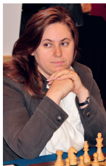
Judit Polgár je považována za nejlepší šachistku všech dob. Proslula agresivní hrou a divokými výměnami.