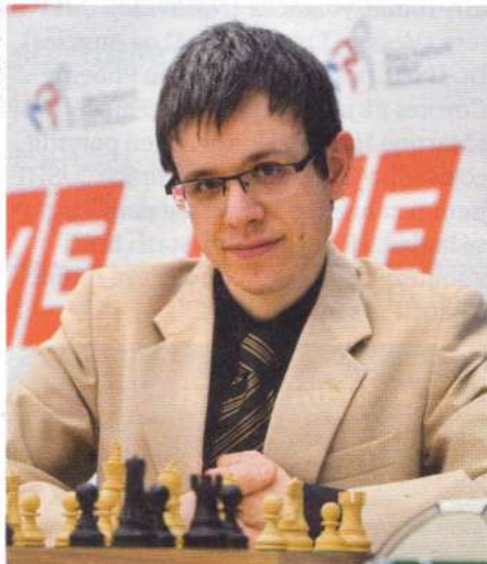
ŠACHOVÝ VELMISTR DAVID NAVARA