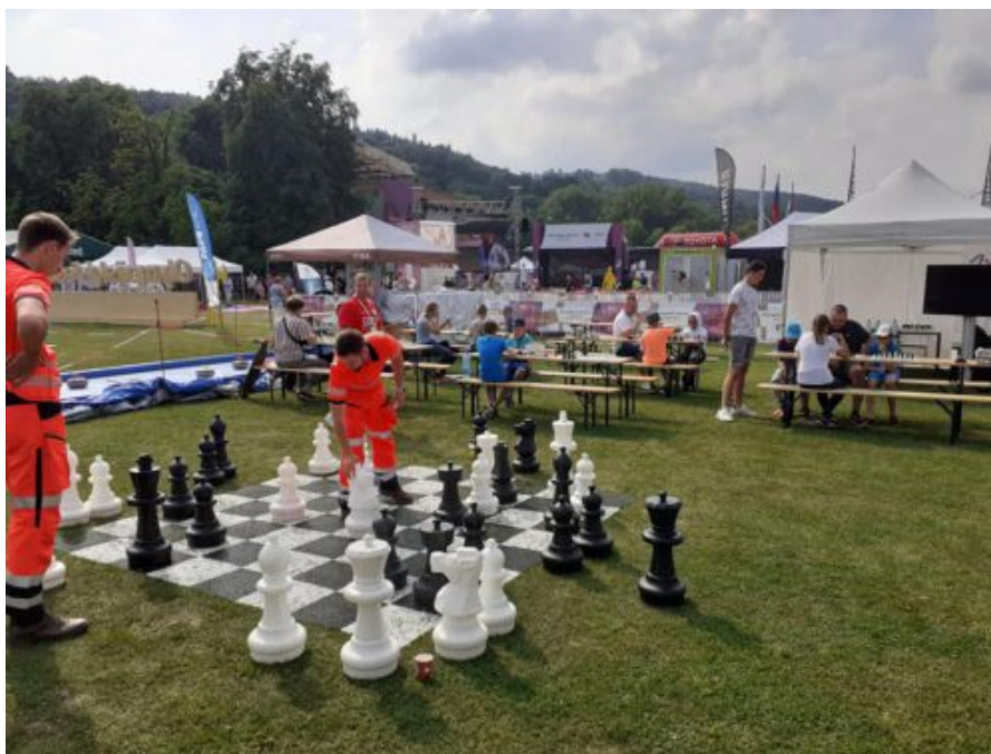
Olympiácký festival Brno – šachový stánek