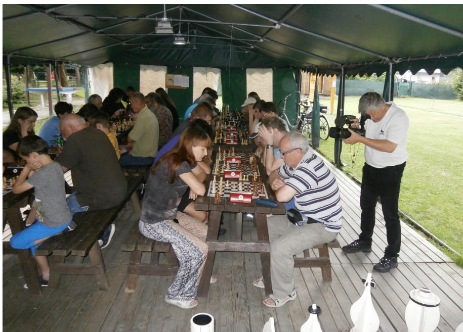
Mohelnické šachování, akce podpořena v grantu 2021

Rok 2021 nebyl výjimkou, v únoru bylo vyhlášeno populární grantové řízení na popularizaci šachu. Do grantového řízení dorazilo i přes nejasnou epidemiologickou situaci hned 26 žádostí. Komise po pečlivém zvážení rozdělila nakonec mezi 23 žadatelů částku 120 tis.