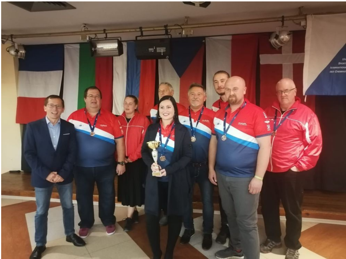
Vyhlásování vítězů mezinárodního mistrovství USIC železničářů v šachu

Na přelomu září a října se v Bulharsku odehrálo mezinárodní mistrovství USIC železničářů v šachu družstev, kde český tým (Flajšman, Horák, Mitura, Musil, Winkelhöfer a Krch) získal bronzové medaile. Detailní výsledky naleznete zde .