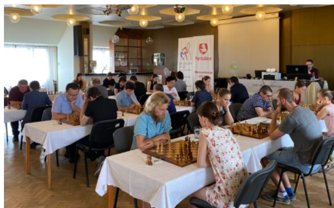
Letní šachové Pardubice

Kromě výše zmíněných akcí proběhlo v roce 2020 hned několik dalších, které zájem o královskou hru bezesporu pozvedly. Mezi tyto akce patří například Pražský šachový festival, Online MČR v bleskovém šachu, reprezentační festival Letní šachové Pardubice, Mezistátní zápas ČR vs. Polsko. Nelze nezmínit ani historicky první online křest knihy Tajná přísada, videa pro šachové začátečníky od Jáchyma Němce a mnoho dalších.