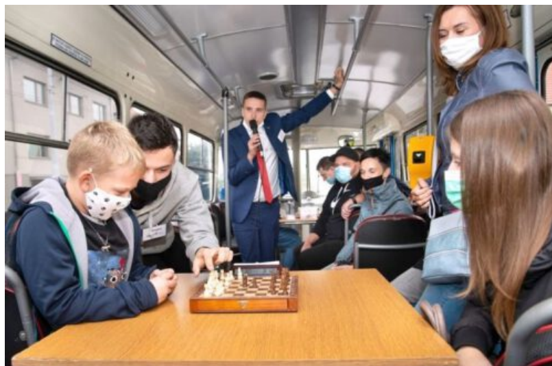
Šachový trolejbus ve Zlíně

vznikl za podpory DP Zlín-Otrokovice a ŠSČR, tak úspěšně navázal na již dva povedené ročníky Šachové šaliny v Brně.