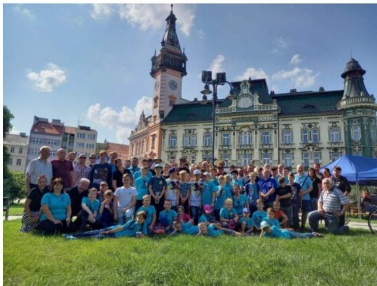
Podpořená akce v Krnově

Bohužel tvrdá hygienická a bezpečnostní opatření související s pandemií znemožnila uspořádání mnoha akcí. Na konci roku 2020 tedy bylo organizátorům vyplaceno pouze 60 000 Kč. I přesto se podařilo povědomí o královské hře rozšířit mezi veřejností například ve Žďáru nad Sázavou, Frýdlantu, Krnově, Mohelnici, Říčanech, Havlíčkově Brodě, Táboře či Vlašimi.