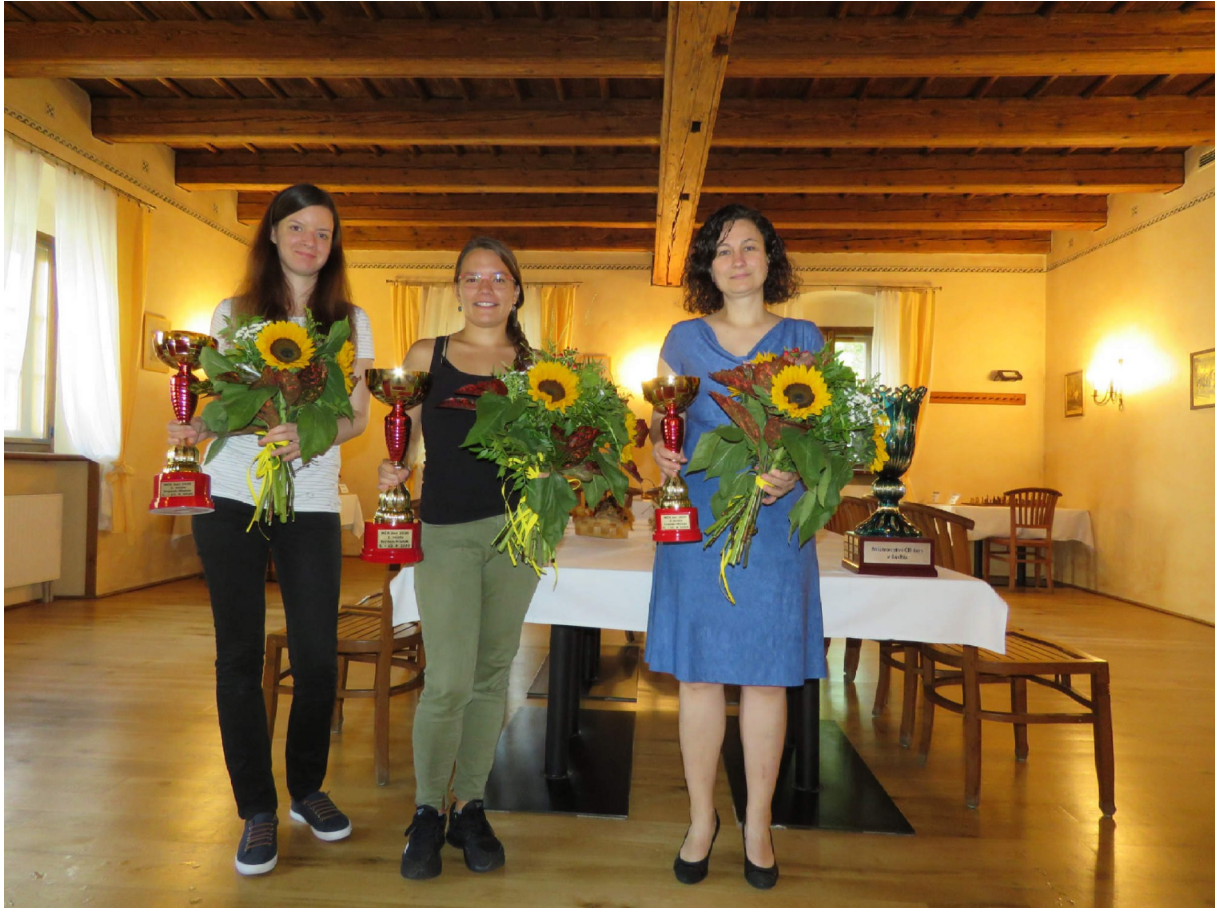
Medailistky MČR žen 2020