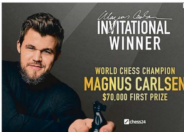
Carlsen opanoval svůj vlastní turnaj. Jako by tím chtěl dokumentovat svoji nadvládu nad světem šachu.

Kromě těch tradičních, kterými jsou například investiční banka Arctic Securities, výrobce polovodičů Nordic Semiconductor či advokátní kancelář Simonsen Vogt Wiig, má smlouvu například také s módní značkou G-Star Raw,