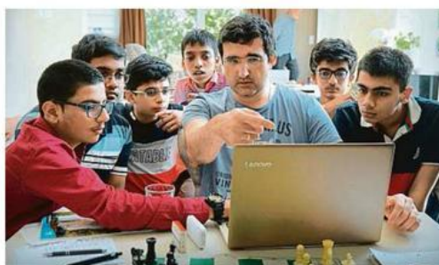
Bývalý mistr světa Vladimír Kramník trénuje indické supertalenty REPRO LN

S rozvolňováním koronavirových opatření, alespoň tedy ve střední Evropě, se všichni šachisté těší, až se zase budou moci z interneto-