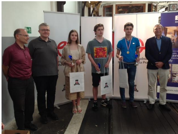
Kategorie seniorů a juniorů