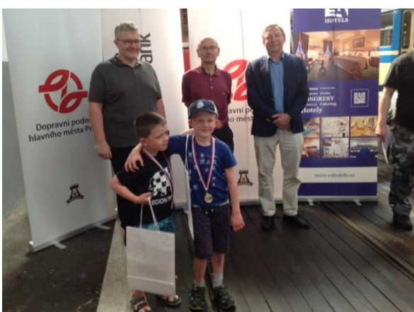
Kategorie U10 a nejmladší účastníci