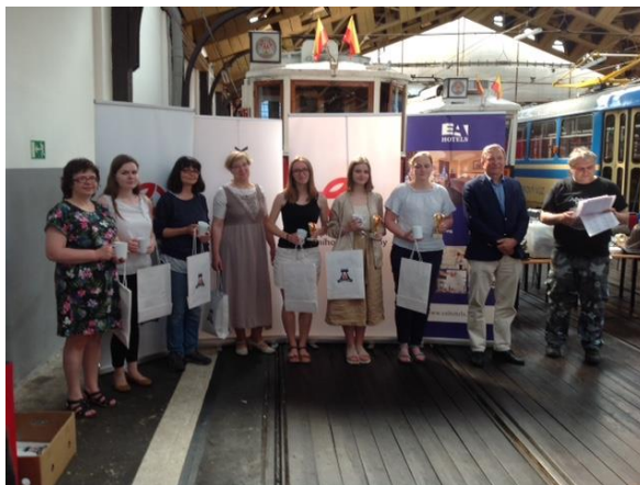
Vítězové turnajů - muži a ženy