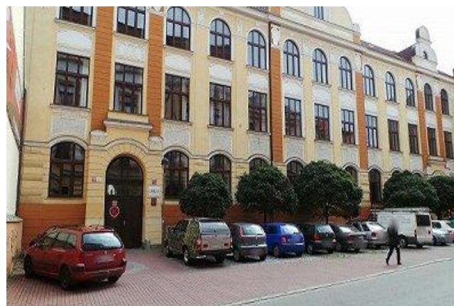
Budova Gymnázia Jírovceva – hlavní vchod z Jírovcevy ulice