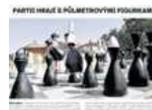
Foto popis | ŠACH MAT. Obří venkovní šachovnice s půlmetrovými dřevěnými figurami, hřiště s posilovacími stroji či pískoviště. To vše je součástí nového přírodního parku ve Vranovicích na pomezí Břeclavska a Brněnska. Otevírají jej v sobotu. „Chtěli jsme vytvořit...