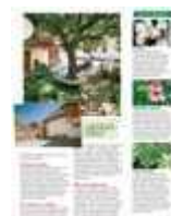
Foto popis | 1 ŠACHY NA LÉTO Majitel zahrady je vášnivý šachista. Figurky na dvůr si dokonce přivezl až ze zahraničí.

rubrika: Návštěva - zahrady - strana: 30 - autor: Olga Trešlová