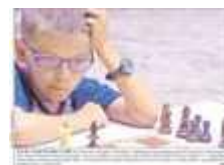
Foto popis| ŠACHY MAJÍ MNOHO TVÁŘÍ. Na šachovém festivalu Czech Open v Pardubicích celou druhou polovinu července současně probíhá přes dvacet různých šachových turnajů a na své si přijdou i vyznavači neobvyklých odnoží královské hry. Soutěží se i v holand'anech,...

rubrika: Severovýchodní Čechy - strana: 12 - autor: (ner)