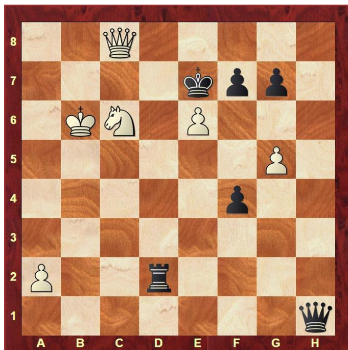
(Kasparov – Navara, pozice po 49. Jc6+)

Naproti tomu David Navara hned v prvním kole efektně prohrál s Levonem Aronjanem a jako by to předznačilo další průběh turnaje. Aronjan si vedl skvěle a Navarovi se příliš nedařilo. Ale prohry našeho reprezentanta si fanoušci za pár týdnů pamatovat nebudou. V historii daleko spíš zůstane partie ze sedmého kola, kdy se Navara vůbec poprvé střetl s Kasparovem. Partie se pro legendární „Bestii z Baku“ vyvíjela dobře, Kasparov získal velkou převahu po zahájení a vzniklou koncovku by nejspíš s Navarou vyhráli i daleko slabší hráči. V časové tísni ale exmistr světa udělal několik nezvyklých chyb, nejlepší český šachista hledal své šance a podařilo se mu partii vyrovnat. Když pak Kasparov spadl do závěrečné léčky, Navara slavil překvapivé vítězství.