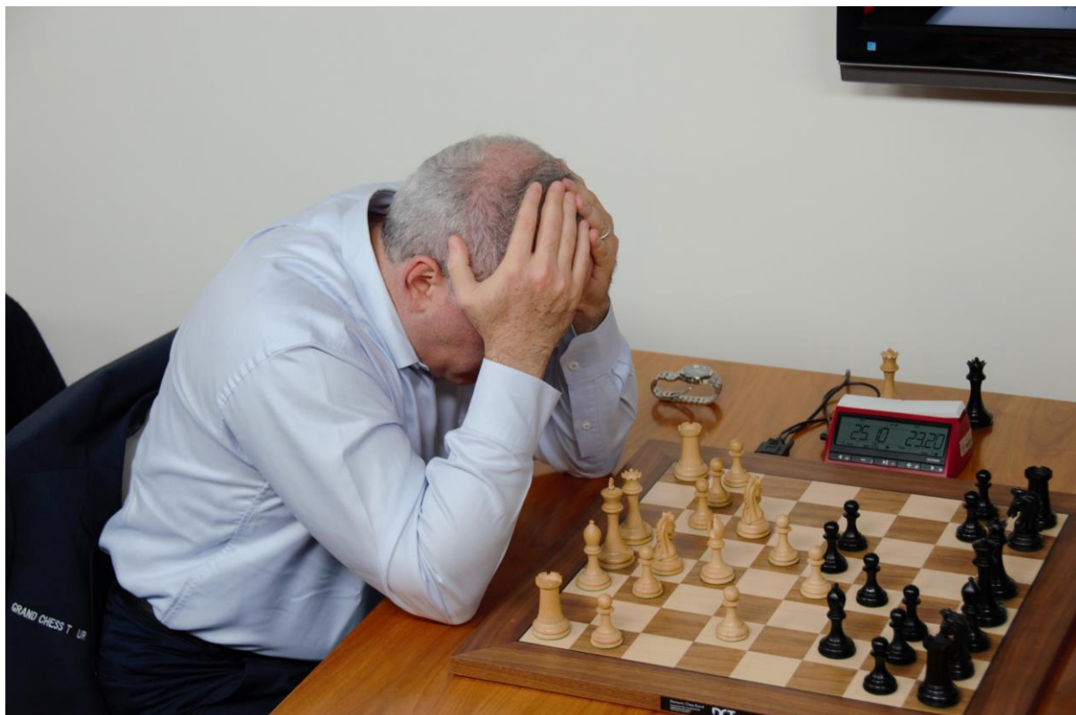
(Garri Kasparov při partii s Davidem Navarou,)

V pozici na diagramu po chybném šachu jezdcem zahrál David Navara jediné, ale vyhrávající 49...Dxc6. Tento motiv viděl už několik tahů dopředu, předtím, než si obě strany postavily dámy. Garri Kasparov černou dámu sebral tahem 50.Dxc6, ale po 50...Vd6 se musel vzdát, černý získává dámu zpět a pěšec na f4 poběží do dámy. Celou napínavou partii si můžete přehrát zde .